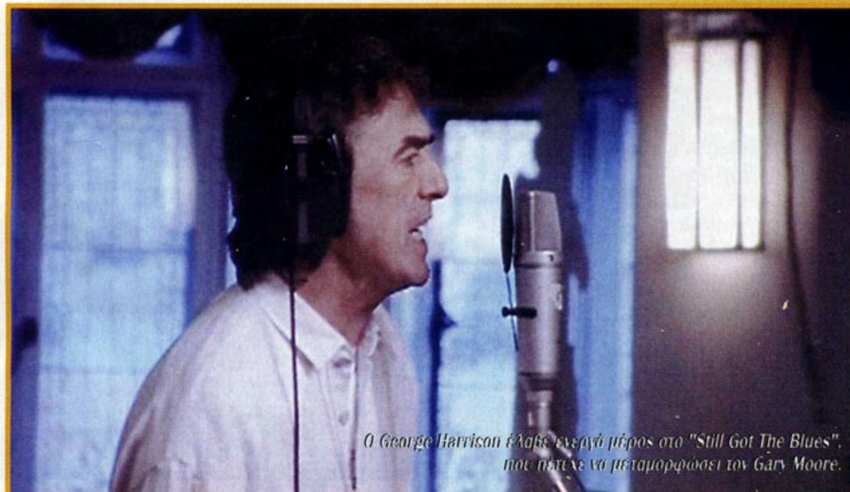
Ο George Harrison έλαβε ενεργό μέρος στο "Still Got The Blues", που πέτυχε να μεταμορφώσει τον Gary Moore.

Δεκαετία του ογδόντα πλέον. Άλλη μια ενδιαφέρουσα συνεργασία προκύπτει για τον Gary Moore που μάλιστα την καλύπτει και ένα άρωμα θρύλου. Ο μπασίστας Greg Lake τον καλεί να παίξει στον προσωπικό δίσκο που ετοιμάζει, αναθέτοντάς του ένα σόλο κιθάρας που κανείς άλλος δε θα μπορούσε να βγάλει όπως έπρεπε.