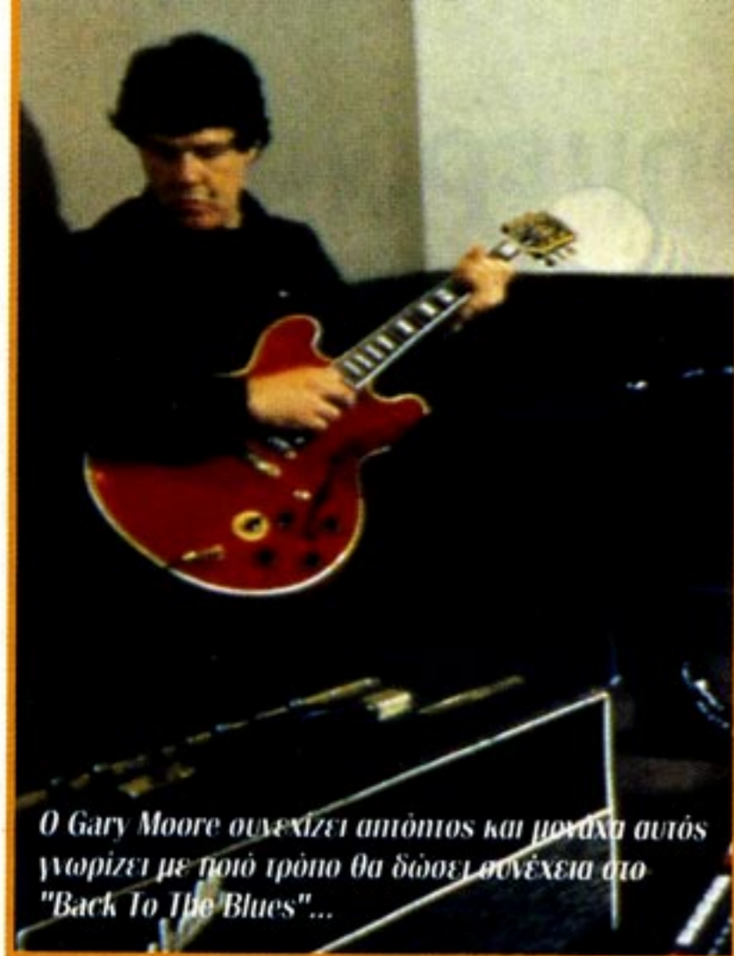
Ο Gary Moore συνεχίζει απότομος και μοναχά αυτός γνωρίζει με ποιό τρόπο θα δώσει συνέχεια στο "Back To The Blues"...

"Still Got The Blues", "Walking by myself" και "King Of The Blues" Στο δίσκο της μεταμόρφωσης του Gary Moore συμμετέχουν τόσο ο Albert King, όσο και ο George Harrison μια δική του σύνθεση. Σε ανταπόδοση ο τελευταίος θα καλέσει τον Gary Moore συμμετάσχει σε ένα τραγούδι των Traveling Wilburys, το "She's My Baby". Ο καινούργιος δρόμος που ακολουθεί ο καλλιτέχνης θα φωτιστεί ακόμα περισσότερο όταν θα του δοθεί η ευκαιρία να βρεθεί στην ίδια σκηνή με τον Albert King και τον Albert Collins στη διάρκεια κάποιας περιοδείας.